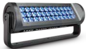
ReachElite eColor 100