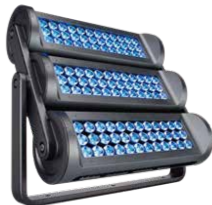
ReachElite eColor 300