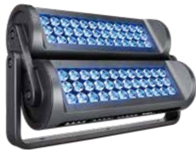
ReachElite eColor 200